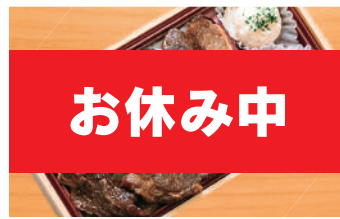
北海道十勝豚焼き肉重 750円(税込) (税抜695円)