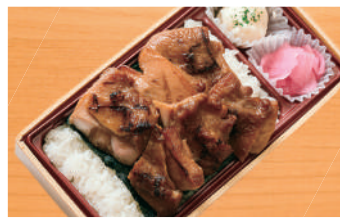
焼き海苔チキンステーキ重 750円(税込) (税抜695円)