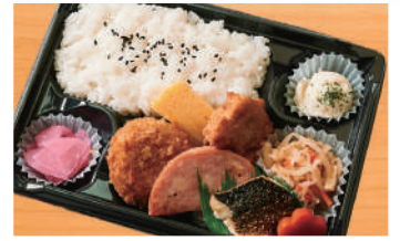
幕の内弁当6D 600円(税込) (税抜556円)