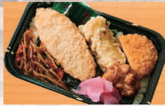
MIXのり弁 500円(税込) (税抜463円)