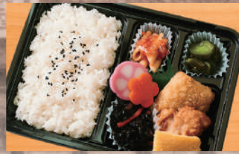
幕の内弁当5C 500円(税込) (税抜463円)