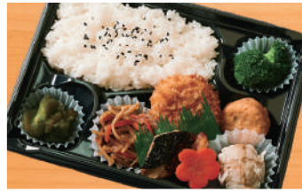
幕の内弁当6B 600円(税込) (税抜556円)