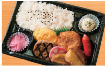
幕の内弁当6A 600円(税込) (税抜556円)