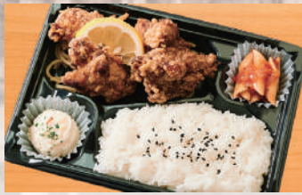
特製和風唐揚げ弁当(4個) 600円(税込) (税抜556円)