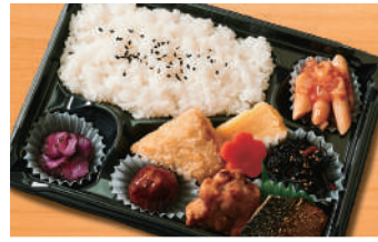
幕の内弁当6C 600円(税込) (税抜556円)