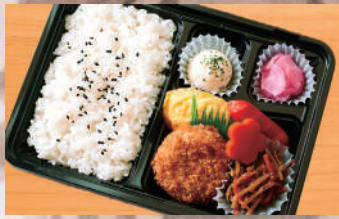
幕の内弁当5A 500円(税込) (税抜463円)