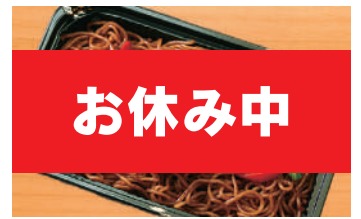
ソース焼きそば 500円(税込) 目玉焼きのせ (税抜463円)