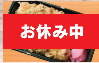
ちくわ天のり弁 500円(税込) (税抜463円)