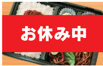
鶏そぼろご飯と 焼きそばセット 500円(税込) (税抜463円)