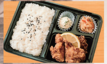
特製和風唐揚げ弁当(3個) 500円(税込) (税抜463円)