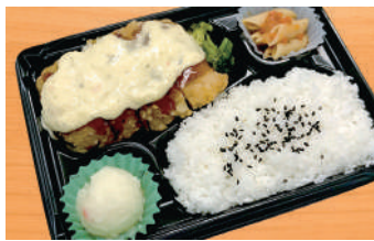
大きなチキン南蛮弁当 700円(税込) (税抜649円)