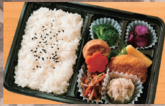
幕の内弁当5B 500円(税込) (税抜463円)