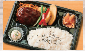
ハンバーグ弁当 600円(税込) (税抜556円)