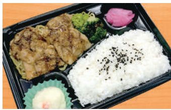
チキンステーキ弁当 600円(税込) (税抜556円)