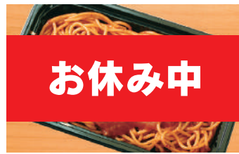
スパゲッティナポリタン 500円(税込) 厚切ハムとオムレツのせ (税抜463円)